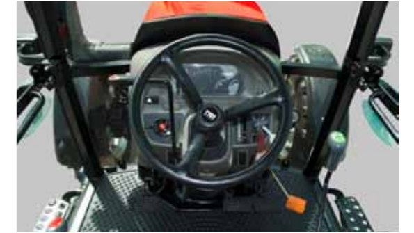
T654 • T754