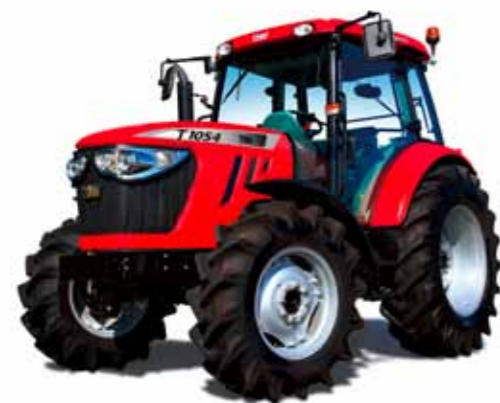
T854 • T954 • T1104