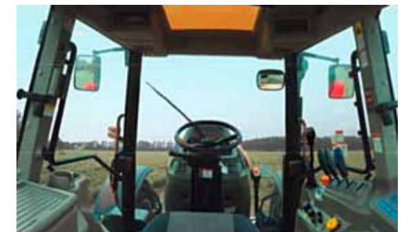
T1204 • T1304