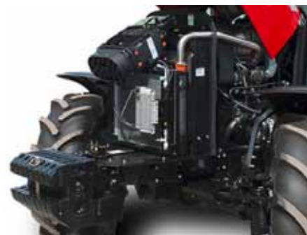
T854 • T954 • T1104