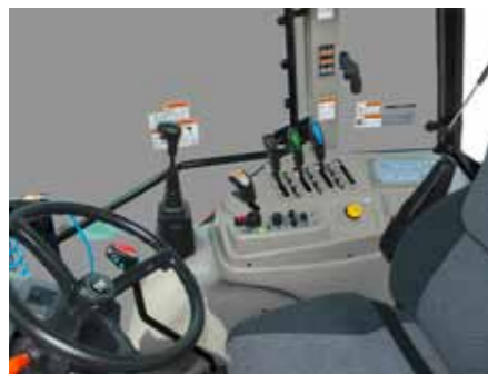
T854 • T954 • T1104