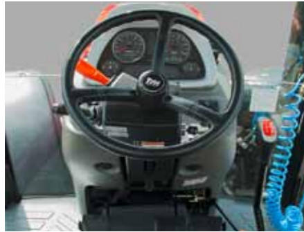
T854 • T954 • T1104