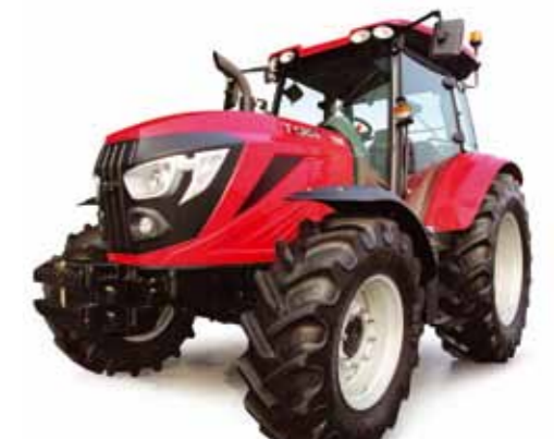
T1204 • T1304