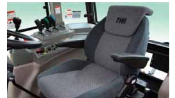
T1204 • T1304